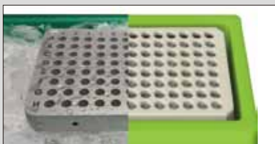
일반 메탈 블럭과 자사 제품과의 물기 생성 비교